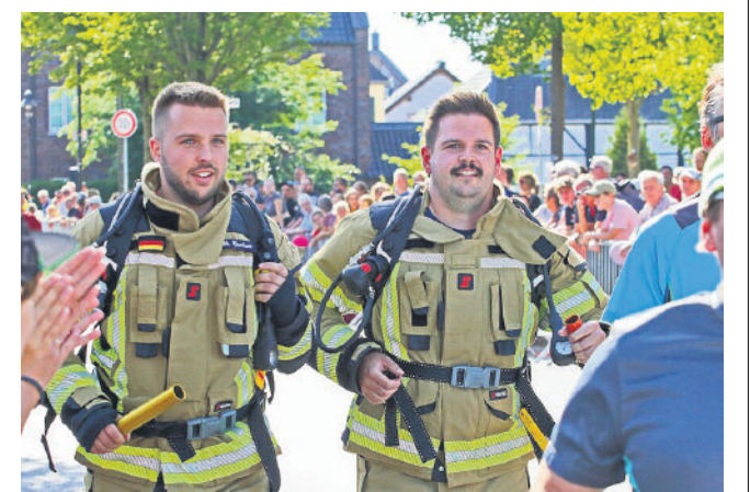
Der historische Ortskern Wachtendonk stand am Sonntag wieder ganz im Zeichen des Laufsports: Die NiersRunners hatten zum 19. Sparkassen-Stadtlauf eingeladen. Zahlreiche Läufer aller Altersklassen gingen noch einmal auf dem Friedensplatz an den Start. Der diesjährige Lauf war der letzte Sparkassen-Stadtlauf in Wachtendonk. Als kleiner Verein mit 50 Mitgliedern sehen sich die NiersRunners nicht mehr in der Lage, die Organisation und Durchführung dieses Laufevents auf die Beine zu stellen. Leider seien auch alle Bemühungen, einen anderen Ausrichter für die Veranstaltung zu finden, erfolglos geblieben.