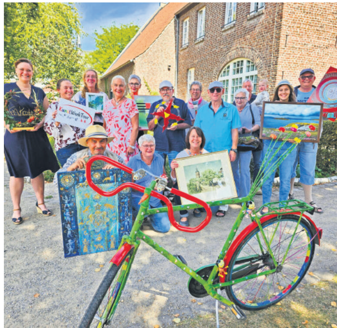
Die KunstWerkTour versammelt viele Mitglieder der Kerkener Künstlerszene.